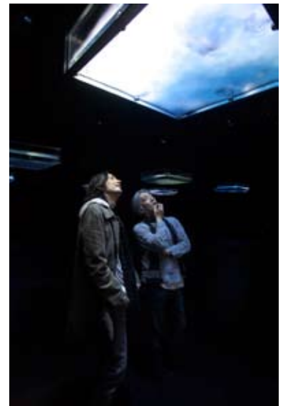
オーディオビジュアル・インスタレーション 「LIFE - fluid, invisible, inaudible ...」 (2006, YCAM委嘱作品)

さらに、2050年に向けて、現在のわたしたちが創造するもの、芸術や文化ができること、残すべきものについて、坂本氏の提言とゲストとのダイアログを、インターネット中継によってYCAMから世界へと発信します。